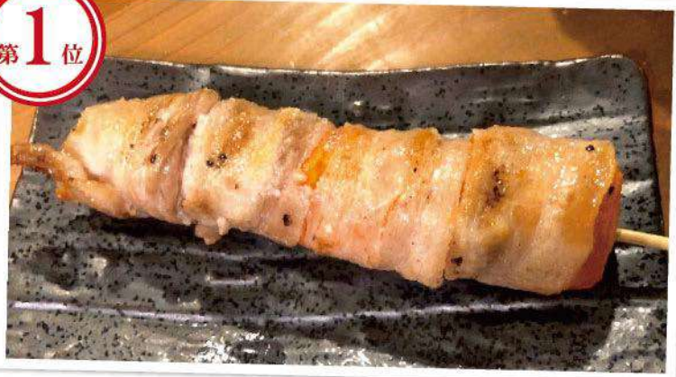
とろける人参の朝霧高原豚巻き串焼き