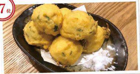
清水産じゃこと豆腐のかき揚げ