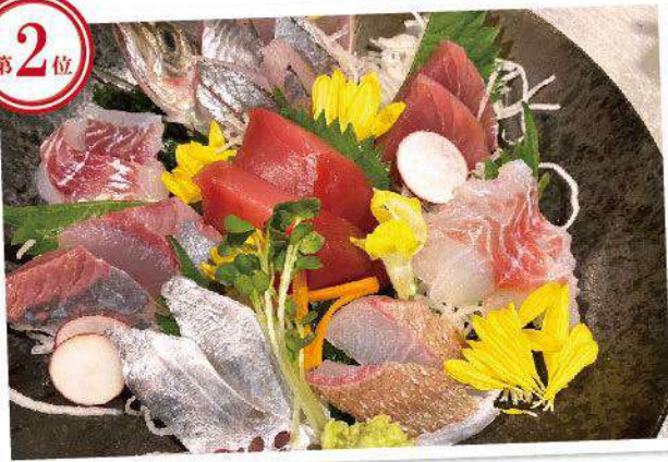
とれたて地魚のお刺身盛り合わせ