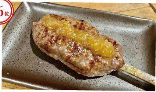
国産黒毛和牛100%つくね